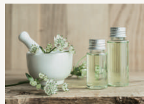
クリアムスク 爽やかなミントとムスクを ベースにしたあまく晴れやかな香り