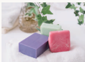
サボン 気品あふれるまるやかで 優しい石鹸の香り