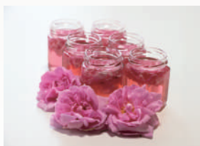
ティーローズ 瑞々しさと甘さを兼ね備えた ローズの香り