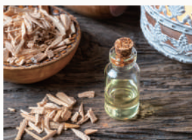
コールドスプリング パチュリやシダーウッドを主体とした ウッディ調のスモーキーな香り