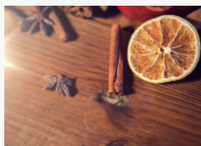
シトラスウッド ベルガモットからウッドへ変化する 奥行きのあるオリエンタルな香り