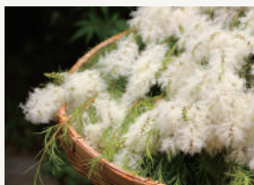
ティーツリー 清涼感のあるさっぱりとした ティーツリーの香り