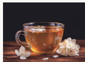
ホワイトティー 落ち着きのあるサンダルウッドと ホワイトティーの上品な香り