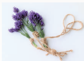
ラベンダーミント ラベンダーとミントを 骨格としたハーブ調の香り