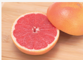
ピンクグレープフルーツ シトラスを基調としたフレッシュな グレープフルーツの香り