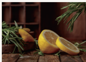
レモン&ジンジャー 爽やかなレモンの香り