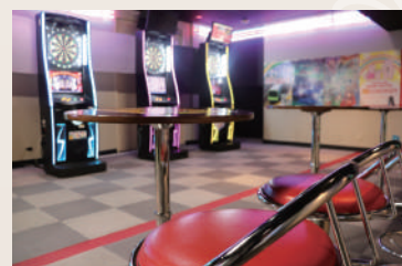
アミューズメント